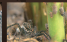
ホッパーレース ウンカとのいたちごっこ 2012年/日本/38分