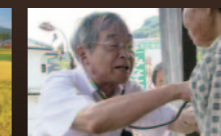
未来への診断書 水俣病と原田正純の50年 2010年/日本/54分