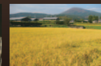
お米が 食べられなくなる日 2012年/日本/35分